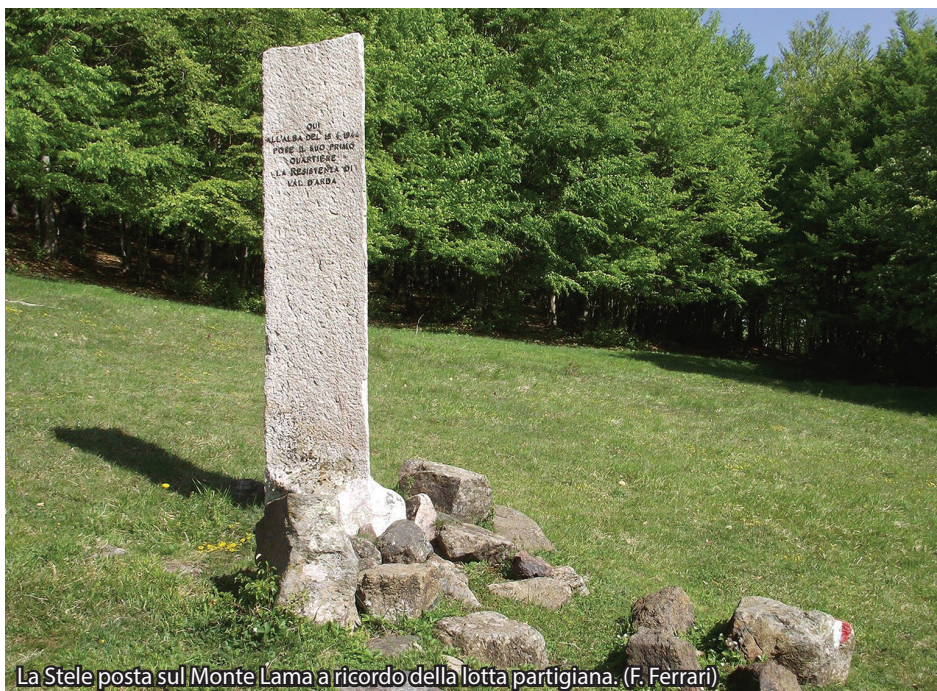
La Stele posta sul Monte Lama a ricordo della lotta partigiana.

COME ARRIVARE IN AUTO ALLA PARTENZA: da Piacenza (60 km) e Fiorenzuola, (40 km) occorre portarsi a Castell'Arquato e seguire le indicazioni per Lugagnano Val d'Arda e Morfasso. Raggiunta la località Sperongia, a sinistra, seguire le indicazioni per Pedina, Rusteghini, Teruzzi.