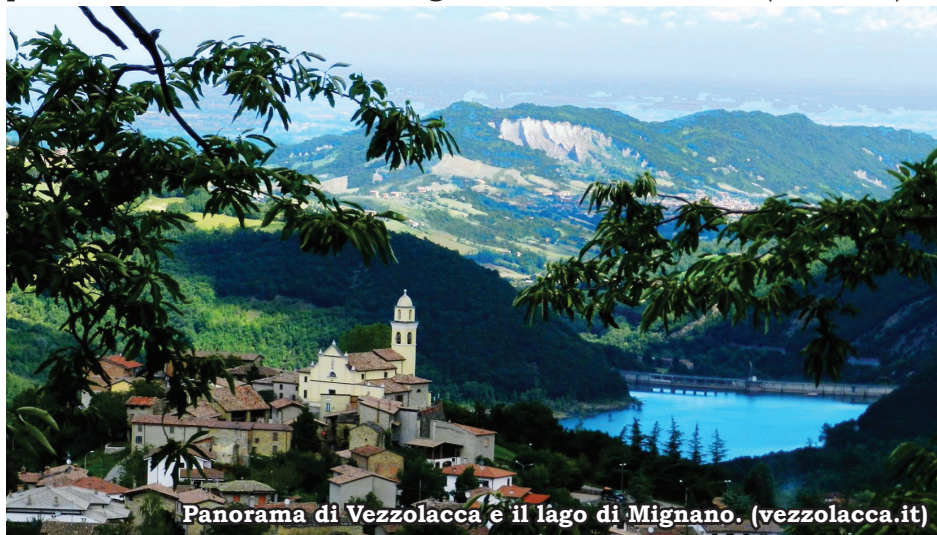
Panorama di Vezzolacca e il lago di Mignano.

IL PERCORSO ESCURSIONISTICO. L'anello A13 parte dal parcheggio del paese, dove in estate si fanno due tra le rassegne popolari più famose in provincia, quali la "Festa della Patata" e la "Festa della Castagna Bionda". Dopo aver raggiunto la chiesa, l'anello si sviluppa nella sua totalità, su sentieri segnati CAI. Dalla piazzetta ci si incammina lungo i sentieri A13 - A12 ( CAI 923 ).