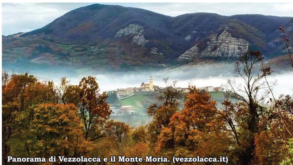
Panorama di Vezzolacca e il Monte Moria.

A12. Da qui i due percorsi proseguono congiuntamente fino a Vezzolacca, come precedentemente esposto nella descrizione dell' Anello A12 . Il percorso è lungo circa 10,5 km ed occorrono circa 4h per compierlo in tranquillità.