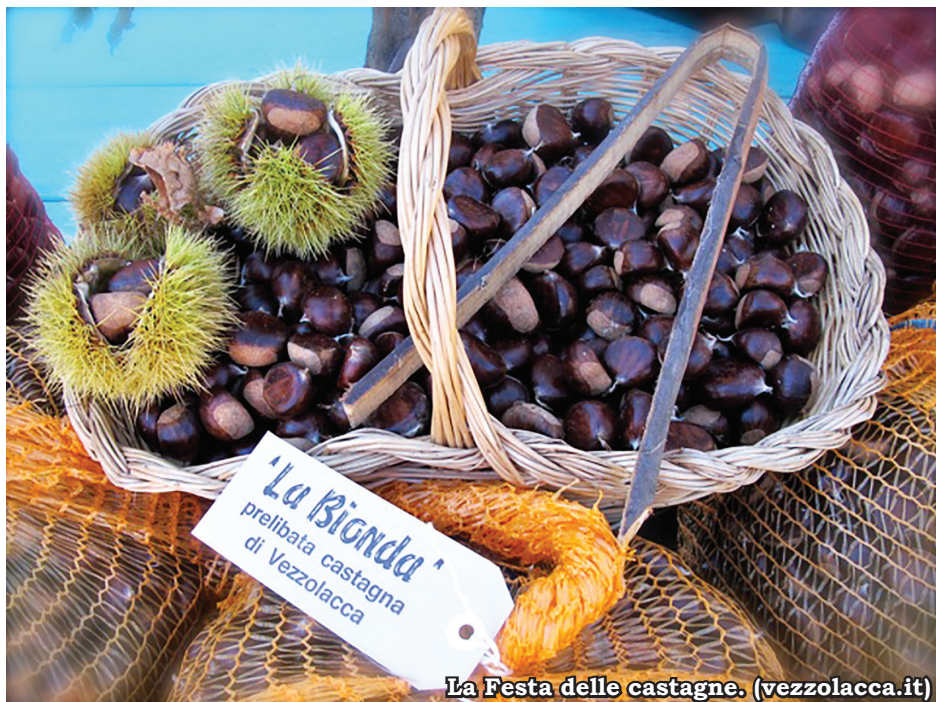
La Festa delle castagne.

A12. Da qui i due percorsi proseguono congiuntamente fino a Vezzolacca, come precedentemente esposto nella descrizione dell' Anello A12 . Il percorso è lungo circa 10,5 km ed occorrono circa 4h per compierlo in tranquillità.