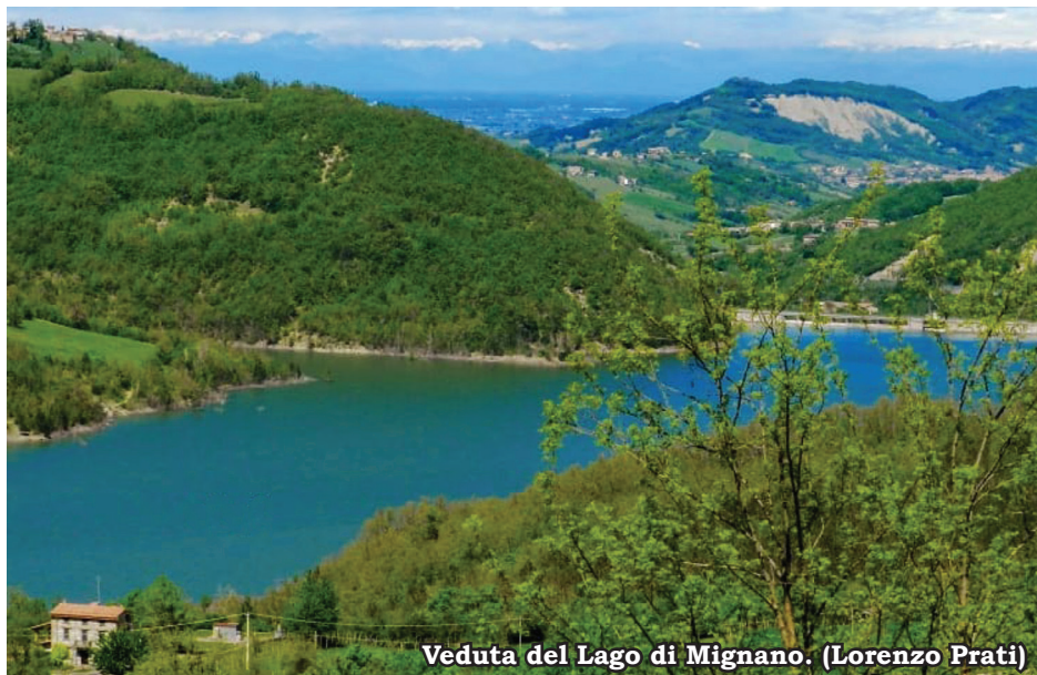
Veduta del Lago di Mignano. (Lorenzo Prati)

Dopo poche centinaia di metri, appena fuori dal paese, in prossimità di un mistadello, il sentiero si inoltra a sinistra, nel grande castagneto che sovrasta Vezzolacca. In salita, continuando sui sentieri A13 - A12 (CAI 923) , si arriva sulla cima del M. Palazza, si continua sul crinale in falsopiano fino alle pendici del M. Lucchi. Qui il sentiero A13 si stacca dal sentiero A12 (il quale continua verso sinistra). Si prosegue verso destra imboccando, in leggera discesa, il sentiero CAI 925b fino ad incrociare il sentiero CAI 925 . Si svolta a destra in discesa lungo quest'ultimo in direzione Dadomo. Il percorso continua in mezzo a grandi castagneti, fino ad arrivare alle vasche dell'acquedotto di Vernasca. Poco dopo, si lascia il sentiero CAI 925 , che scende a destra a Dadomo. Si prosegue sul sentiero CAI 925a , piegando verso sinistra fino ad incrociare il sentiero CAI 923a che proviene dalla Bocchetta di Settesorelle. Si gira a sinistra e poco dopo, una ripida ma breve salita porta il nostro sentiero A13 sulla cima del M. Costaccia. Qui si trovano dei ripetitori e il monumento dedicato ai Caduti di tutte le guerre. Siamo in comune di Bore, provincia di Parma. Poco oltre il monumento, si prende il sentiero CAI 923 , direzione M. Mu, il punto più alto del nostro anello (mt 953). Il percorso continua fino a ricongiungersi, alle pendici del M. Lucchi, con il percorso