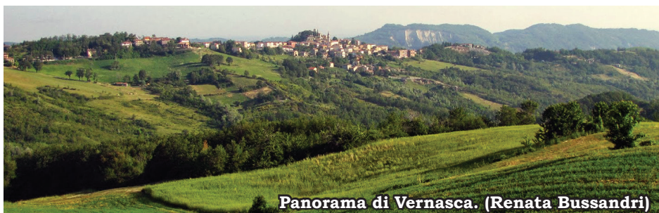
Panorama di Vernasca. (Renata Bussandri)

IL PERCORSO ESCURSIONISTICO. Il sentiero ad anello A16 detto anche Anello del Monte Lanzone inizia dalla piazza principale di Vernasca, dov'è posta la bacheca informativa. Seguendo la strada asfaltata SP4 direzione Bore, ripercorrendo lo stesso percorso del "Cammino di S. Franca", si giunge al bivio per la frazione Gallosi. Arrivati a Gallosi si prende la strada sterrata a sinistra che porta alla località Alessandrone. Da qui una ripida salita a sinistra si arriva ad incrociare la strada ghiaiaata che dalla provinciale SP4 porta a Vitalta. Seguire la strada a destra e una volta arrivati a Vitalta, dove S. Franca ebbe le sue origini, proseguire in salita a sinistra verso l'Oratorio a Lei dedicato. Dopo aver fatto una visita e recitato una prece presso l'oratorio, proseguire a sinistra nel bosco, nella stessa direzione del sentiero A15 , fino a quando i due sentieri si dividono. Mentre il sentiero A15 gira a destra, il sentiero A16 gira a sinistra fino a raggiungere di nuovo la SP4, si passa a sinistra sotto il Ponte di Lanzone e dopo si ritorna sulla SP4, si percorrono poche centinaia di metri, e a destra riprende in salita il sentiero sterrato che porta fino a Torre Burgazzi, un monumento fatto erigere nei primi anni del '900 dalla ricca famiglia Burgazzi. Da questo luogo si può godere di una magnifica vista su Vernasca. Il sentiero porta velocemente a Costa Bignoni, dove, a sinistra, si segue il percorso A17 , sul sentiero CAI 929 . Da qui si raggiunge Vernasca.