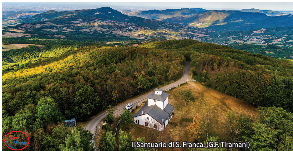
Il Santuario di S. Franca. (G.F. Tiramani)

IL PERCORSO ESCURSIONISTICO. Il sentiero ad anello A2 , riconosciuto dal CAI, inizia dalla piazza principale di Morfasso, dov'è posta la bacheca informativa e percorre il tratto fino a Santa Franca, in comune con il sentiero A1 , con segnavia bianco/giallo. Percorre a destra un breve tratto di strada asfaltata fino a superare il torrente Lubiana. Superato il ponte, dopo pochi metri a sinistra inizia il sentiero sterrato che conduce a Rocchetta e al Santuario dedicato a S. Franca. Il rientro a Morfasso avviene percorrendo il sentiero CAI 901 con segnavia bianco/rosso. Dopo un breve tratto asfaltato in lieve discesa, alla prima curva della strada, s'inoltra nel bosco (ingresso a sinistra) in direzione Montelana e lo si segue fino a Guselli. Appena superate le case, a destra riprende il tratto del sentiero A2 che porta a Sartori e Rocchetta. (Da Guselli in alternativa e/o in caso di terreno molto bagnato, si può seguire la strada asfaltata fino a ricongiungersi con il sentiero A2 poco prima di Sartori). Giunti a Rocchetta, il sentiero ripercorre a sinistra con segnavia bianco/giallo, il tratto comune con il sentiero A1 che conduce a Morfasso.