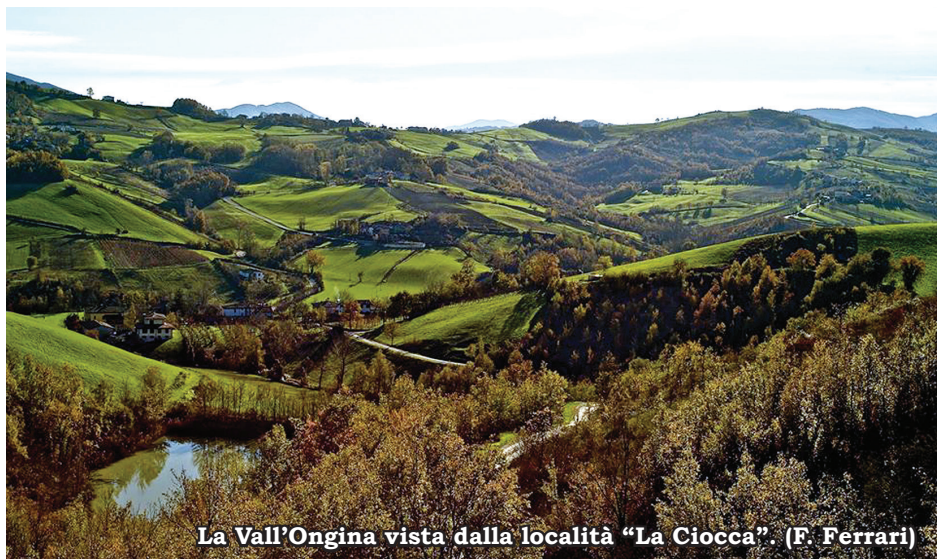
La Vall'Ongina vista dalla località “La Ciocca”.