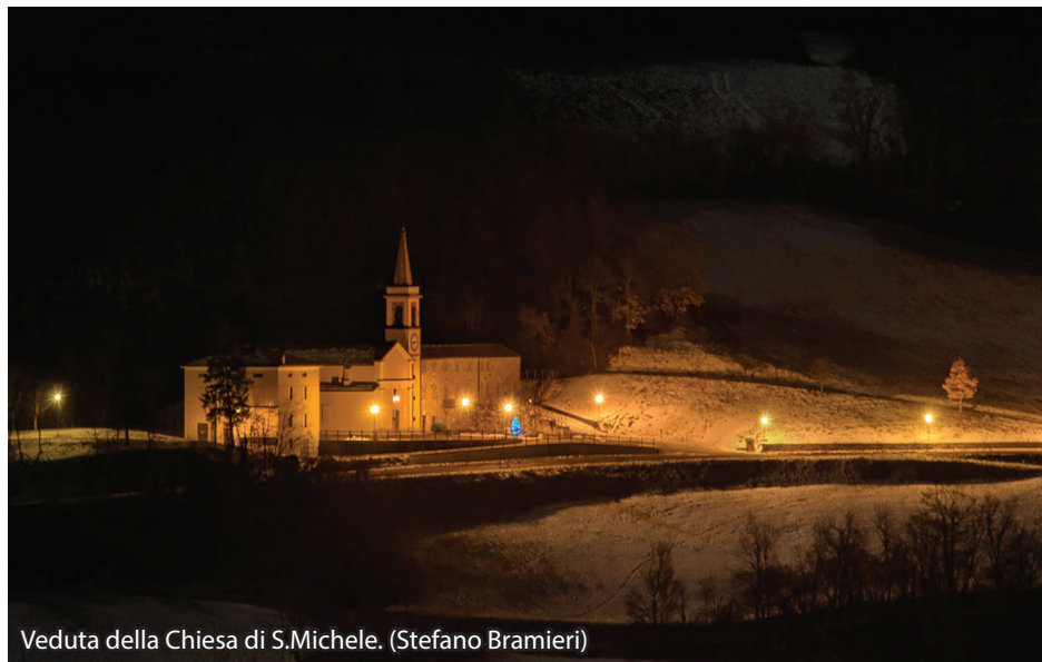
Veduta della Chiesa di S.Michele. (Stefano Bramieri)

IL PERCORSO ESCURSIONISTICO. Il punto di partenza e arrivo è stabilito in San Michele, davanti all'albergo Rapacioli, dov'è posta la bacheca informativa. Il sentiero A5 arriva su asfalto alla frazione Oddi. Si continua, a sinistra, in leggera salita passando davanti all'agriturismo "La Risorgiva", poi si prosegue su un ripido sentiero, la cui parte finale è in asfalto, che porta nel borgo di Malvisi. Da quest'ultima località, il tracciato A5 discende fino ad attraversare la SP14 per dirigersi verso il torrente Chero e raggiungere Bertonnazzi. Superata questa località si sale nuovamente fino a incrociare la strada provinciale SP10 per Prato Barbieri. Dalla piccola frazione si continua sulla strada SP15 in direzione