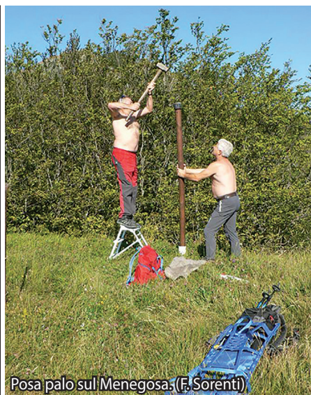
Posa palo sul Menegosa.