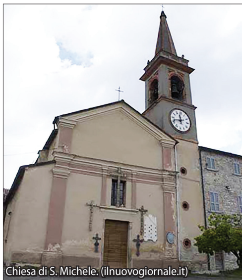
Chiesa di S. Michele.

Passo dei Guselli. Posto quasi nella parte sommitale del comune di Morfasso, il Passo segna lo spartiacque tra le valli dei torrenti Chero e Lubiana, affluente dell'Arda.