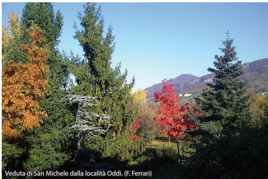
Veduta di San Michele dalla località Oddi.

IL PERCORSO ESCURSIONISTICO. Il punto di partenza e arrivo dell'Anello A6 è stabilito in San Michele, davanti all'albergo Rapioli, dov'è posta la bacheca informativa. Dopo aver percorso il tratto di marciapiede in direzione Veleia, si transita dalla chiesa parrocchiale e poche decine di metri oltre, a sinistra, si prende una stradina asfaltata in discesa verso il torrente Chero. Dopo un paio di curve, il sentiero A6 prosegue su fondo sterrato fino a raggiungere la frazione La Cà e continua dritto, sbucando sulla strada provinciale SP14 in prossimità del bivio per la località Monte di Veleia. Si gira a sinistra e dopo circa 200 metri, in prossimità di un'ampia curva, il nostro percorso gira a sinistra e s'inoltra nel boschetto. Percorrendo tale sentiero si sbuca nuovamente sulla SP14 e a sinistra, in breve si arriva a Carignone. Dopo il ristorante "Il Gladiatore", ci s'inoltra nella piccola frazione a sinistra fino a girare a destra per seguire il sentiero A6 fino a Veleia. Da quest'ultima località seguire il sentiero CAI 911 che consente di raggiungere la Madonna del Monte nel Parco del Moria. Dalla chiesetta si prosegue sulla strada asfaltata del Parco (sentiero CAI 901) in direzione del Rifugio del Parco. Al rifugio medesimo si devia a destra per il sentiero CAI 913 che porta prima al Monte Cornetto e poi in ripida discesa a Cà delle Donne, per continuare fino a raggiungere San Michele, il punto di arrivo dell'anello escursionistico A6.