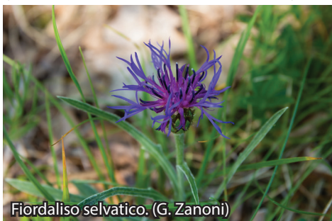
Fiordaliso selvatico. (G. Zanoni)

Parco del Monte Moria (vetta a 1072 mt.). Il Parco occupa una superficie di oltre 1000 ettari nei comuni di Morfasso e Lugagnano. L'area naturale, con il prevalere di grandi boschi, è un altopiano montuoso con la cima più alta rappresentata dal M. Croce dei Segni (1072 mt.). Nel suo cuore è ubicata la chiesa dedicata alla Madonna del Monte, ricostruita in tempi recenti nel luogo dove pare sorgesse una cappella dipendente dall'abbazia di Val Tolla. Attorno alla Chiesa si estendono suggestivi castagneti secolari che a Ferragosto, per la grande festa popolare di San Rocco, ospitano centinaia di villeggianti tra i quali numerosi emigranti locali.