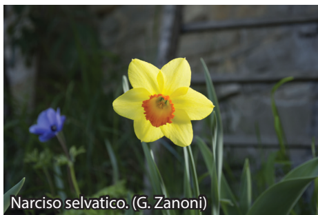
Narciso selvatico. (G. Zanoni)