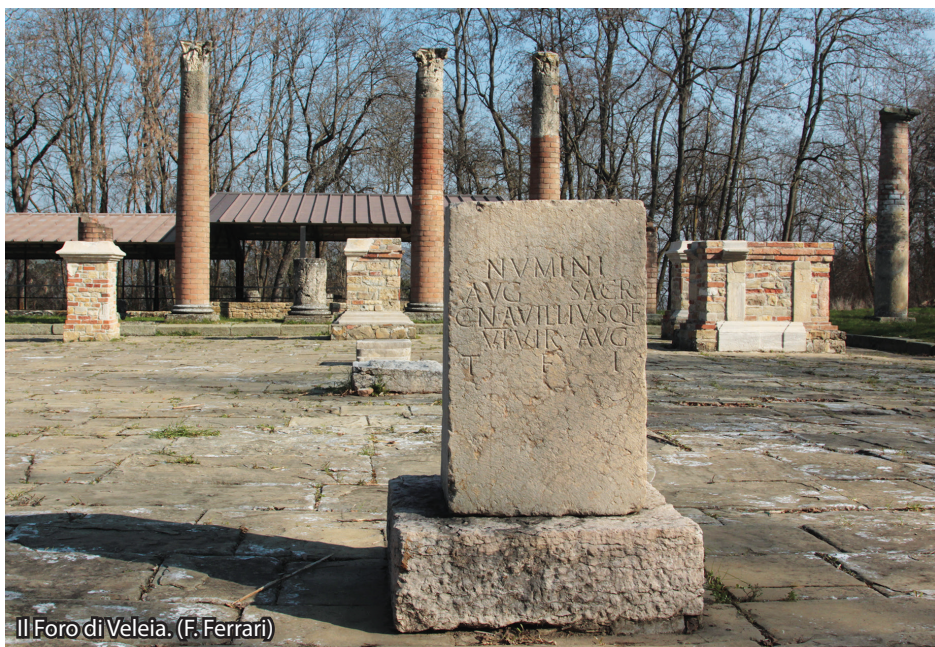
Il Foro di Veleia. (F. Ferrari)