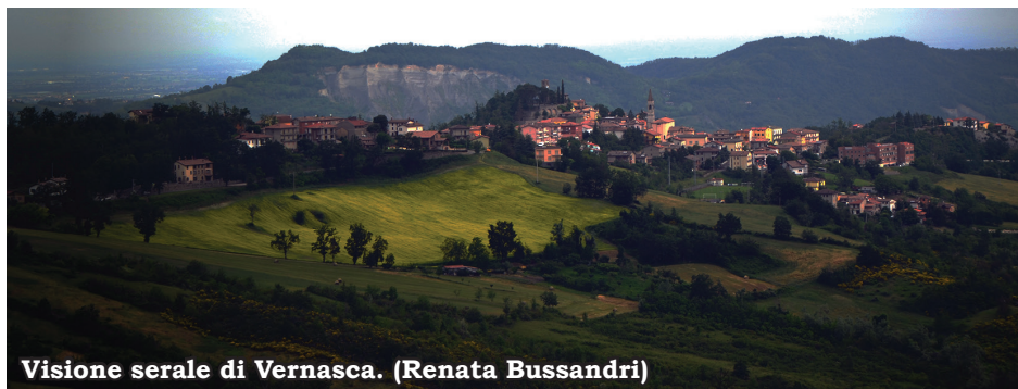
Visione serale di Vernasca. (Renata Bussandri)

Sul percorso Vigoleno-Vernasca, tutti gli anni in giugno, in una notte di luna piena, si svolge una camminata molto caratteristica - LA NOTTE DEI BRIGANTI. Il percorso, lungo 8.5 km circa. È adatto a tutti si snoda lungo un suggestivo cammino sterrato che, attraverso il crinale costeggiato da boschi e prati, conduce a Vernasca.