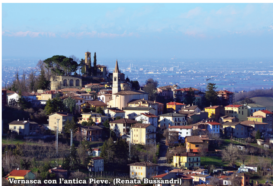
Vernasca con l'antica Pieve. (Renata Bussandri)