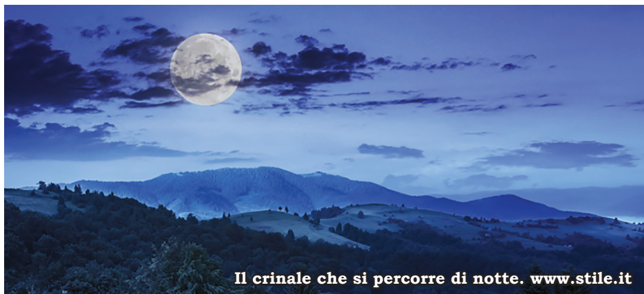
Il crinale che si percorre di notte. www.stile.it

Grazie, mentre la Pieve romanica di S. Giorgio ricrea all'interno un'atmosfera mistica. Dopo lo spuntino, si riprende l'escursione per il nostro sentiero seguendo la stradina asfaltata che scende e gira attorno al Monte S. Giovanni. Lungo questo percorso si può godere la visione spettacolare della val Stirone. Si arriva in località