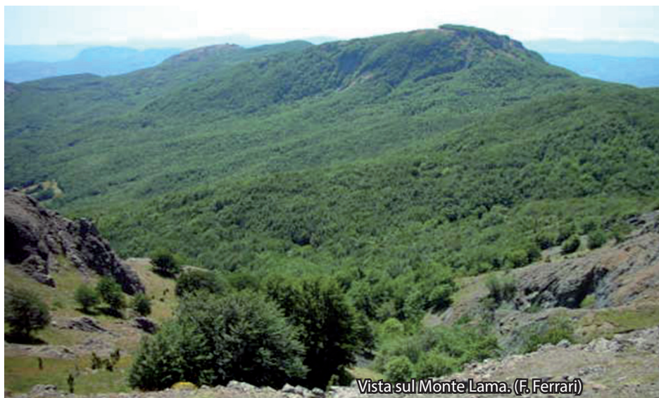
Vista sul Monte Lama. (F. Ferrari)

da asfaltata e risale in direzione Croce dei Segni-Parco del Moria. Sempre seguendo il CAI 901 si raggiunge il rifugio-bar-ristorante e, poco oltre, la chiesetta della Madonna del Monte, il punto terminale del sentiero lineare S1 . Per chi volesse proseguire per Veleia o per Rabbini-Monastero, esistono due sentieri diretti: il CAI 909 che raggiunge Rabbini-Monastero, passando per Tavernelle e il CAI 911 che raggiunge Veleia, dopo aver superato il Prato delle Lame e la frazione La Villa.