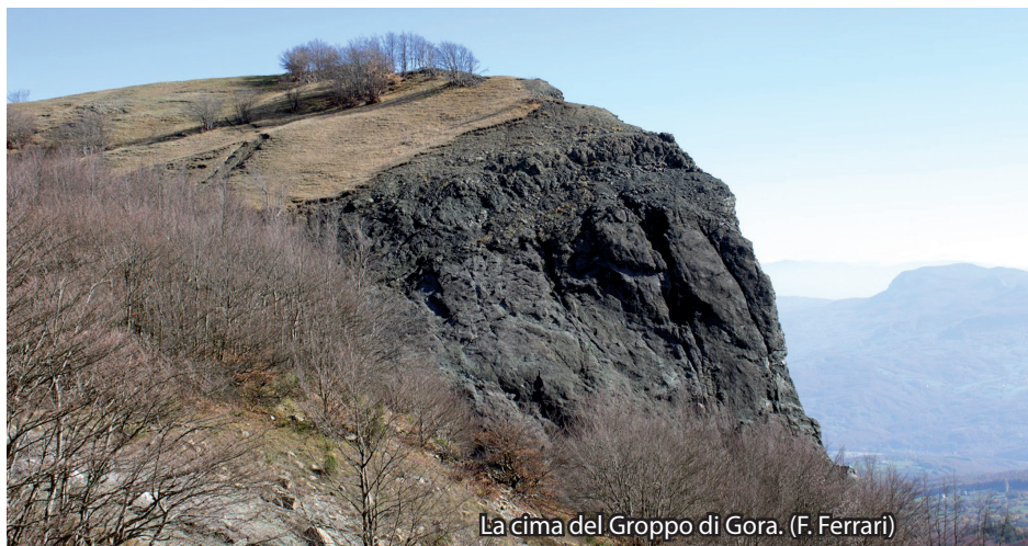
La cima del Gruppo di Gora. (F. Ferrari)