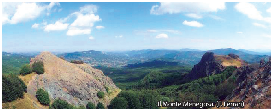
Il Monte Menegosa.

IL PERCORSO ESCURSIONISTICO. Il sentiero inizia dal Passo del Pelizzone, seguendo la carrareccia con il segnavia CAI 907 in direzione Groppo di Gora-M. Lama. Raggiunta la cabina di decompressione del gas, si continua lungo la Costa del monte Pelizzone per il Groppo di Gora, alle pendici del quale, il sentiero si divide in due. Chi prosegue a sinistra, supera la cima del "Groppo" e raggiunge il Colle del Castellaccio. Chi al bivio preferisce aggirare la cima del monte, svolta a destra seguendo il segnavia AVC/A10 fino a ricollegarsi con il sentiero CAI 907 . Arrivati ai piedi della sella del Colle del Castellaccio (1308 mt.), si prosegue in direzione M. Lama. Si attraversano radure, pascoli e boschi d'alta quota e, sempre continuando sul sentiero CAI 907 , si raggiunge il prato sommitale del Lama sul quale è stata posizionata una grande croce.