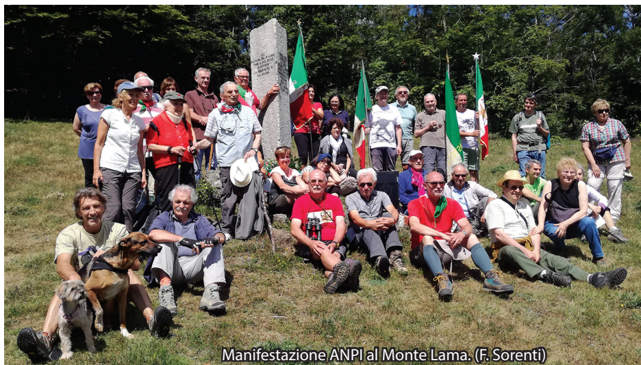
Manifestazione ANPI al Monte Lama. (F. Sorenti)

da asfaltata e risale in direzione Croce dei Segni-Parco del Moria. Sempre seguendo il CAI 901 si raggiunge il rifugio-bar-ristorante e, poco oltre, la chiesetta della Madonna del Monte, il punto terminale del sentiero lineare S1 . Per chi volesse proseguire per Veleia o per Rabbini-Monastero, esistono due sentieri diretti: il CAI 909 che raggiunge Rabbini-Monastero, passando per Tavernelle e il CAI 911 che raggiunge Veleia, dopo aver superato il Prato delle Lame e la frazione La Villa.